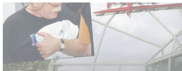
Bardzo rzadko pokazuje swoją twarz, ale jego głos znają wszyscy