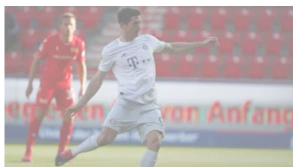
Była gwiazda Bayernu nie wierzy w rekord Lewandowskiego