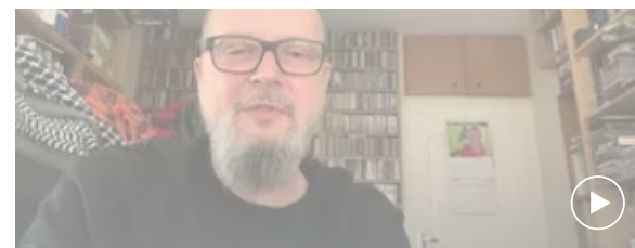
"Jesteśmy rządzani przez szarańczę, która zostawia zgliszcza"