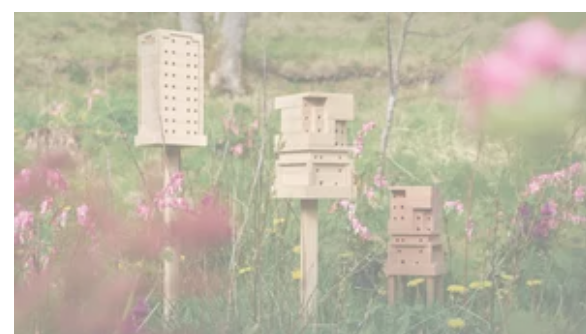
Ikea po raz kolejny w słusznej sprawie. Oto domowy ul