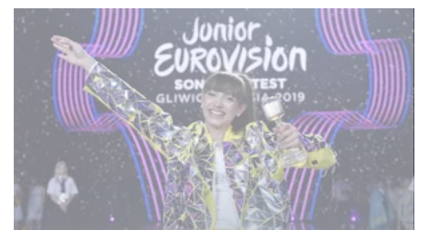
Eurowizja Junior nie odbędzie się w Krakowie. Znamy powód